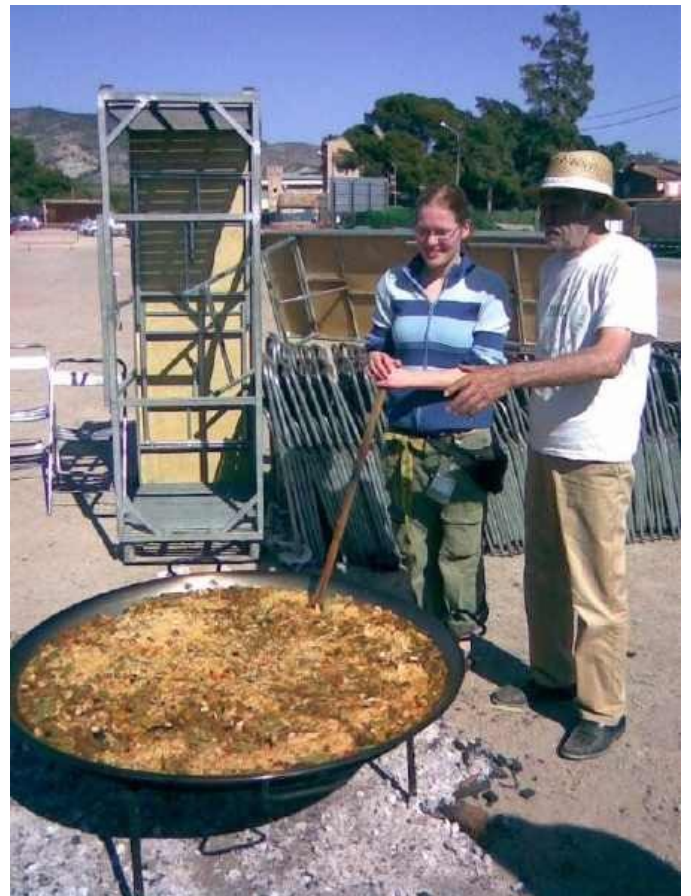
Iberia Renkontiĝo en Benicàssim

Lun. 24 marto, denove junula manĝo-klaĉo ĉe Nian, juna ĉina studentino en Tuluzo.